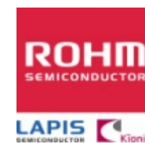
RPM7238-H13R Rohm Semiconductor RECEIVER REMOTE 37.9KHZ RSIPA3 H