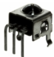
RPM7238-H8R Rohm Semiconductor RECEIVER REMOTE CTRL 37.9KHZ TOP