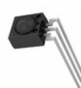
RPM7237-V4R Rohm Semiconductor RECEIVER REMOTE CTRL 36.7KHZ L