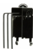
RPM7238-H4R Rohm Semiconductor RECEIVER REMOTE CTRL 37.9KHZ TOP