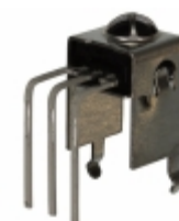
RPM7238-H9R Rohm Semiconductor RECEIVER REMOTE CTRL 37.9KHZ TOP