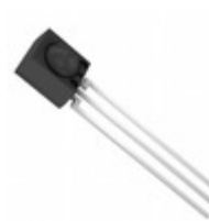
RPM7238-R Rohm Semiconductor RECEIVER REMOTE CTRL 37.9KHZ STR