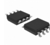
SY100EL51ZC Microchip Technology IC D-TYPE POS/NEG 8SOIC