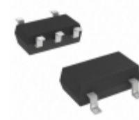
MIC5365-2.7YC5-TR Microchip Technology IC REG LDO 2.7V 0.15A SC70-5