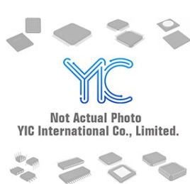
MIC5365-2.7YC5 MICREL MIC5365-2.7YC5 MICREL