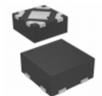
MIC5365-2.5YMT-TR Microchip Technology IC REG LDO 2.5V 0.15A 4TMLF