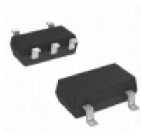
MIC5365-2.7YC5-TR Microchip Technology IC REG LDO 2.7V 0.15A SC70-5