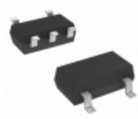
MIC5365-2.6YC5-TR Microchip Technology IC REG LDO 2.6V 0.15A SC70-5