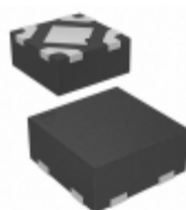
MIC5365-2.6YMT-TZ Microchip Technology IC REG LDO 2.6V 0.15A 4TMLF