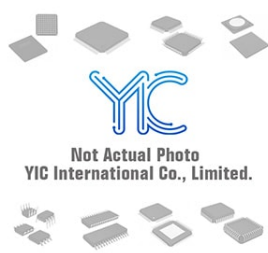
SY88982LMI MICREL SY88982LMI MICREL