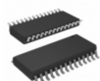
PIC18F2439-I/SO Microchip Technology IC MCU 8BIT 12KB FLASH 28SOIC