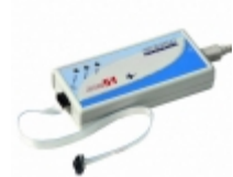
ADM51 IAR Systems Software Inc DEBUGGER IN CIRC FLASH PROG