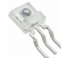
TSL254RSM-LF ams IC LIGHT TO VOLTAGE SENSOR 3SMD