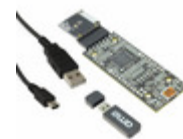
TSL2540-EVM ams EVAL BOARD FOR TSL2540