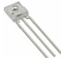
TSL254R-LF ams IC LIGHT TO VOLTAGE SENSOR 3PIN