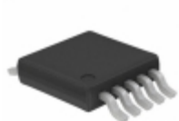
SY88903VKG-TR Microchip Technology IC AMP POST PECL 3.3V TTL 10MSOP