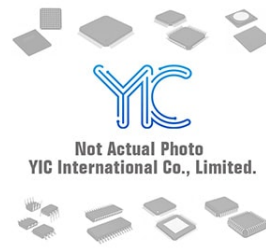
SY88903VKGTR MICREL SY88903VKGTR MICREL