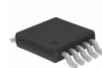
SY88905KC-TR Microchip Technology IC LASER CTRLR 1.25GBPS 10MSOP