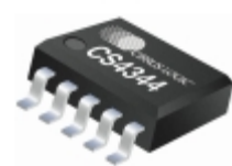
CS4344-CZZR Cirrus Logic Inc. IC DAC 24BIT 192KHZ 10-TSSOP