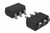
DMA204030R Panasonic Electronic Components TRANS 2PNP 50V 0.1A/0.5A MINI6