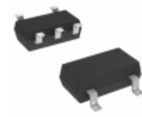
DMA261020R Panasonic Electronic Components TRANS PREBIAS DUAL PNP MINI5