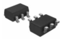
DMA206010R Panasonic Electronic Components TRANS 2PNP 50V 0.1A MINI6