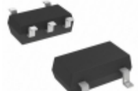
DMA201010R Panasonic Electronic Components TRANS 2PNP 50V 0.1A MINI5