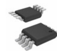
SY100EL16VFKG-TR Microchip Technology IC RCVR DIFF 5V/3.3V 8-MSOP