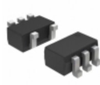
UMC5NT1 ON Semiconductor TRANS BRT NPN/PNP DUAL SOT-353