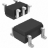
UMC5NQ-7 Diodes Incorporated PREBIASTRANSISTORSOT353