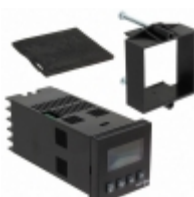
T1641100 Red Lion Controls CONTROL TEMP 85-250V PANEL MOUNT