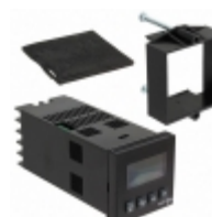
T1641110 Red Lion Controls CONTROL TEMP 24V 18-36V PANEL MT