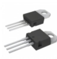
T1635T-8T STMicroelectronics TRIAC ALTERNISTOR 800V TO- 220AB