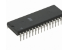
AT49F002T-12PC Microchip Technology IC FLASH 2MBIT 120NS 32DIP