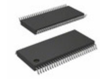
74VCX162601MTD Fairchild/ON Semiconductor TXRX 18BIT UNIV BUS LV 56TSSOP