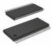
74VCX162601MTDX Fairchild/ON Semiconductor TXRX 18BIT UNIV BUS LV 56TSSOP