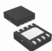
FPF2701MPX Fairchild/ON Semiconductor IC LOAD SWITCH 0.4-2A OCP 8MLP