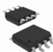
FPF2701MX Fairchild/ON Semiconductor IC LOAD SWITCH 0.4-2A OCP 8SOIC