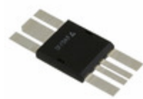
IXRFD631 IXYS IC MOSFET DVR RF 30A LOW DCB