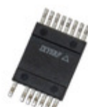
IXRFD607X2 IXYS RF 15A LOW SIDE MOSFET DRIVER IN SM