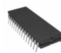
ADG506ATQ Analog Devices Inc. IC MULTIPLEXER 16X1 28CDIP