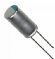
567ULR6R3MEF Illinois Capacitor CAP ALUM POLY 560UF 20% 6.3V T/H