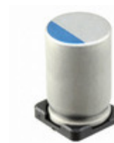
567UVG010MFBJ Illinois Capacitor CAP ALUM POLY 560UF 20% 10V SMD