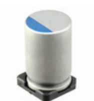
567UVG4R0MFBJ Illinois Capacitor CAP ALUM POLY 560UF 20% 4V SMD