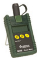
567XL Greenlee Communications OPTICAL PWR METER FC/SC/ST CONN