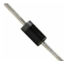
BZX85C18_T50A Fairchild/ON Semiconductor DIODE ZENER 18V 1W DO41