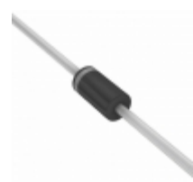
BZX85C18-TR Electro-Films (EFI) / Vishay DIODE ZENER 18V 1.3W DO41