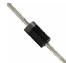
BZX85C20 Fairchild/ON Semiconductor DIODE ZENER 20V 1W DO41