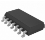
PIC16HV753T-I/SL Microchip Technology IC MCU 8BIT 3.5KB FLASH 14SOIC