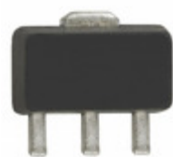
RF33377TR7 RFMD IC AMP HBT GAAS GEN-PUR SOT-89