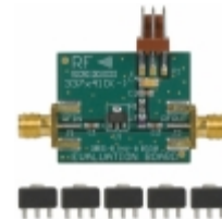
RF33376PCK-410 RFMD KIT EVAL FOR RF33376