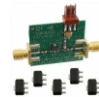
RF33375PCK-410 RFMD KIT EVAL FOR RF33375