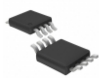
LT1396CMS8#PBF Linear Technology IC OPAMP CFA 400MHZ 8MSOP