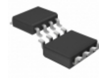
LT1395CS8#TRPBF Linear Technology IC OPAMP CFA 400MHZ 8SO