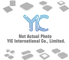
LT1396CMS8 LT LT MSOP8