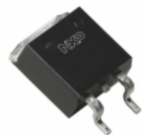
BTA316B-800C,118 WeEn Semiconductors TRIAC 800V 16A D2PAK