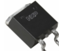
BTA316B-600E,118 WeEn Semiconductors TRIAC SENS GATE 600V 16A D2PAK