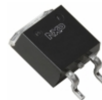
BTA316B-600C,118 WeEn Semiconductors TRIAC 600V 16A D2PAK