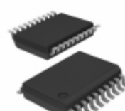
PIC16C621-20I/SS Microchip Technology IC MCU 8BIT 1.75KB OTP 20SSOP