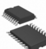
PIC16C621-20I/SO Microchip Technology IC MCU 8BIT 1.75KB OTP 18SOIC