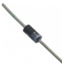
1N4748AE3/TR13 Microsemi Corporation DIODE ZENER 22V 1W DO204AL