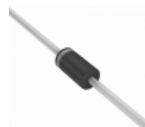
1N4748AHR1G TSC (Taiwan Semiconductor) DIODE ZENER 22V 1W DO204AL