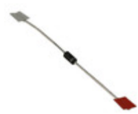
1N4748A-TP Micro Commercial Co DIODE ZENER 22V 1W DO41G