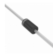
1N4748A-TAP Vishay Semiconductor Diodes Division DIODE ZENER 22V 1.3W DO204AL