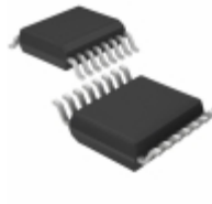
ADN4666ARUZ-REEL7 ADI (Analog Devices, Inc.) IC RCVR DIFF LVDS QUAD 16TSSOP