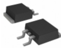
C3D06060G-TR Cree/Wolfspeed DIODE SCHOTTKY 600V 6A TO263-2