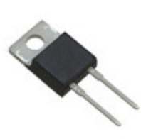
C3D06065A Cree/Wolfspeed DIODE SCHOTTKY 650V 6A TO220-2