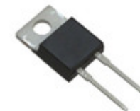
C3D08060A Cree/Wolfspeed DIODE SCHOTTKY 600V 8A TO220-2