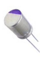
16SEPG270M Panasonic CAP ALUM POLY 270UF 20% 16V T/H