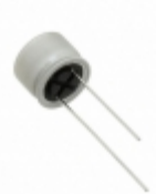
16SEQP150M Panasonic Electronic Components CAP ALUM POLY 150UF 20% 16V T/H