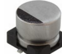
16SEV1000M12.5X13.5 Rubycon CAP ALUM 1000UF 20% 16V SMD