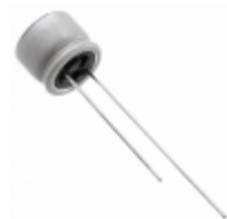
16SEQP82M Panasonic CAP ALUM POLY 82UF 20% 16V T/H