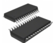
AD9826KRSZ Analog Devices Inc. IC IMAGE SGNL PROC 16BIT 28-SSOP