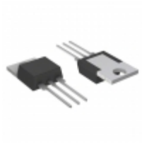
QK008LH4 Littelfuse Inc. TRIAC ALTERNISTOR 1KV 8A TO220