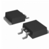
QK008NH4TP Littelfuse Inc. TRIAC ALTERNISTOR 1KV 8A TO263