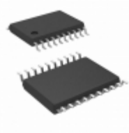
MC74VHCT541ADTR2 ON Semiconductor IC BUFF/DVR 8BIT N-INV 20TSSOP