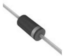
P6KE6.8CA B0G TSC (Taiwan Semiconductor) TVS DIODE 5.8V 10.5V DO204AC