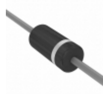
P6KE6.8C-E3/54 Vishay Semiconductor Diodes Division TVS DIODE 5.5VWM 10.8VC DO204AC