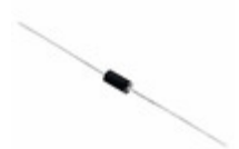
P6KE6.8CA Littelfuse Inc. TVS DIODE 5.8VWM 10.5VC DO204AC