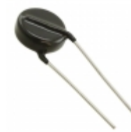
ERZ-E14A821 Panasonic Electronic Components VARISTOR 820V 7.5KA DISC 17.5MM