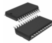
LTC1277CSW#TRPBF Linear Technology IC A/D CONV 12BIT W/SHTDN 24SOIC