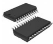
LTC1277CSW#TRPBF ADI (Analog Devices, Inc.) IC A/D CONV 12BIT W/SHTDN 24SOIC