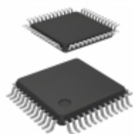
CDK3401CTQ48X Exar Corporation IC VIDEO DAC 10BIT 3CH TQFP