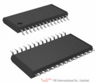
Image may be representation. See specs for product details.