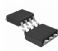
OP27GS8#PBF ADI (Analog Devices, Inc.) IC OPAMP GP 8MHZ 8SO