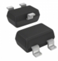
BC856CW-G Comchip Technology TRANS PNP 65V 100A SOT323