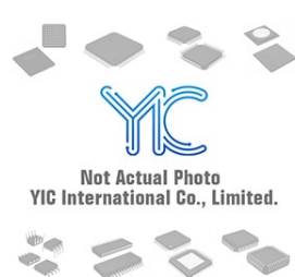
BC856G-B Original BC856G-B Original