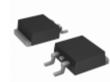
T1235H-6G-TR STMicroelectronics TRIAC ALTERNISTOR 600V 12A D2PAK