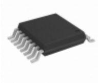
PCA9704PWJ NXP USA Inc. IC GPI 16BIT SPI 18V INT 16TSSOP