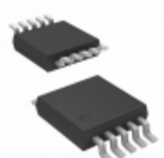
MCP4242-502E/UN Microchip Technology IC DGTL POT DL 5K 2CH 10-MSOP