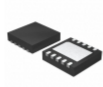
MCP4242-103E/MF Microchip Technology IC POT DGTL DUAL 10K RHEO 10DFN