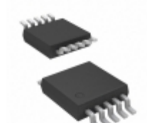
MCP4242T-103E/UN Microchip Technology IC RHEOSTAT 10K 2CH 10MSOP