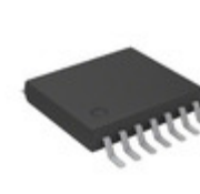
MCP4241T-503E/ST Microchip Technology IC DGTL POT 50K 2CH 14TSSOP