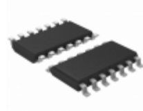
MAX489ECS Maxim Integrated IC TXRX RS485/RS422 LOPWR 14SOIC