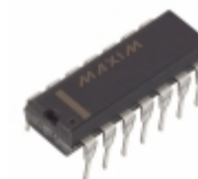
MAX489CPD+ Maxim Integrated IC TXRX RS485/RS422 LOWPWR 14DIP