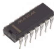
MAX489ECPD+ Maxim Integrated IC TXRX RS485/RS422 14-DIP