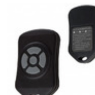
CMD-KEY5-315 Linx Technologies Inc. XMITTER KEYFOB 315MHZ 5 BUTTON