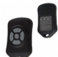
CMD-KEY5-418 Linx Technologies Inc. XMITTER KEYFOB 418MHZ 5 BUTTON