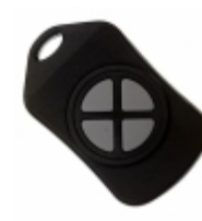
CMD-KEY4-418 Linx Technologies Inc. XMITTER KEYFOB 418MHZ 4 BUTTON