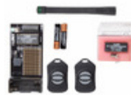
CMD-KEY3-315 Linx Technologies Inc. XMITTER KEYFOB 315MHZ 3 BUTTON