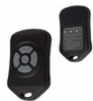
CMD-KEY5-433 Linx Technologies Inc. XMITTER KEYFOB 433MHZ 5 BUTTON