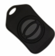
CMD-KEY3-433 Linx Technologies Inc. XMITTER KEYFOB 433MHZ 3 BUTTON