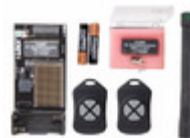
CMD-KEY4-315 Linx Technologies Inc. XMITTER KEYFOB 315MHZ 4 BUTTON