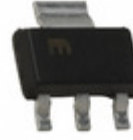
MIC5209-3.3YS Microchip Technology IC REG LDO 3.3V 0.5A SOT223