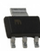
MIC5209-3.3YS-TR Microchip Technology IC REG LDO 3.3V 0.5A SOT223