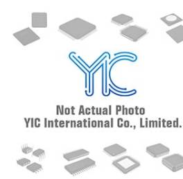
MIC5209-3.3YS TR MICREL MIC5209-3.3YS TR MICREL