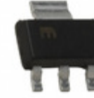
MIC5209-3.6BS TR Microchip Technology IC REG LDO 3.6V 0.5A SOT223