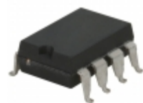
LAA127PTR IXYS Integrated Circuits Division RELAY OPTOMOS 200MA DP 8FLTPK