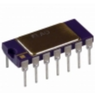
AD636JD Analog Devices Inc. IC TRUE RMS/DC CONV MONO 14-CDIP