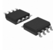
AT25320W-10SI Microchip Technology IC EEPROM 32KBIT 3MHZ 8SOIC