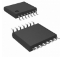
AT25320T1-10TI-2.7 Microchip Technology IC EEPROM 32KBIT 3MHZ 14TSSOP