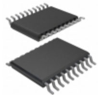
AT25320T2-10TC Microchip Technology IC EEPROM 32KBIT 3MHZ 20TSSOP