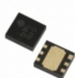
XC6124F627ER-G Torex Semiconductor Ltd IC WATCHDOG TIMER 6-USP