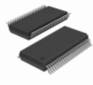
QS3VH16862PAG8 IDT, Integrated Device Technology Inc IC BUS SWITCH 20BIT HI 48-TSSOP